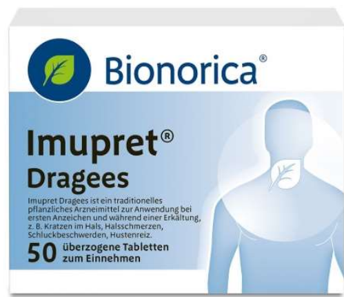
Abbildung 11 Imupret Dragees / Tropfen

Gegenanzeigen: Überempfindlichkeit gegen die Wirkstoffe, gegen andere Korbblütler, z.B. Beifuß, Schafgarbe, Chrysantheme, Margerite... 59