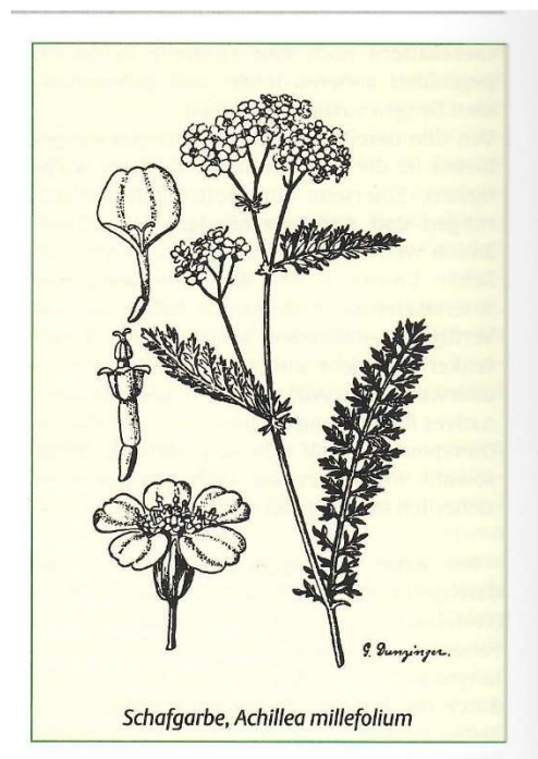
Abbildung 2: Schafgarbe, Achillea millefolium

Die Farbe der Zungenblüten ist bei manchen Sippen ausschließlich weiß (z. B. A. collina , A. pratensis , A. pannonica ), selten cremeweiß ( A. setacea ), und bei manchen Sippen zartrosa (z. B. A. roseo-alba ) sowie besonders in der engeren Verwandtschaft A. millefolium weiß, rosa bis hin zu rot. 20