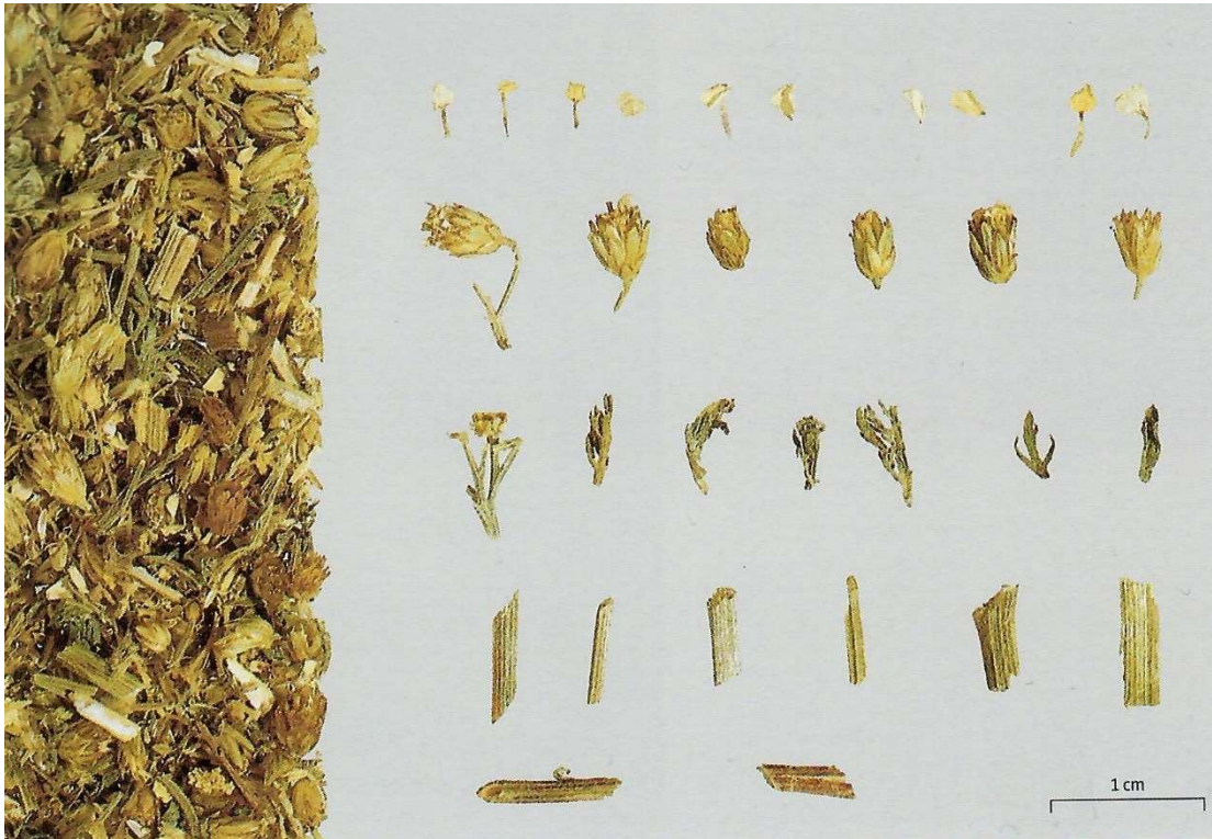
Abbildung 6 Schafgarbenkraut, Millefolii Herba (Wichtl, 6. Auflage, 2016, S. 432)

Grün, teilweise braun oder violett überlaufen, behaart, längs-rinnig, bis 3 mm dick, hat ein helles Mark 21