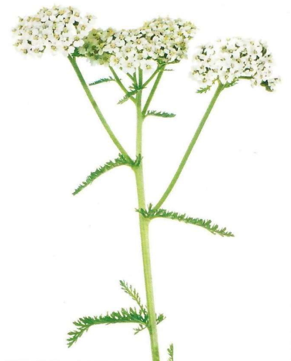
Abbildung 1 (Wichtl, 6. Auflage, 2016) Achillea millefolium L., Blütenstand

an der Karl Landsteiner Universität in Krems