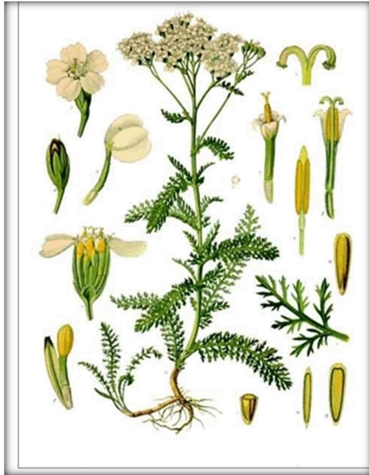
Abbildung 6: Illustration aus Koehlers's Medizinalpflanzen (Koehler, 1887)