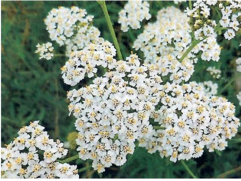
Abbildung 3: Achillea millefolium Blüten