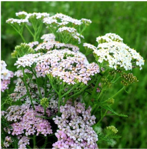
Abbildung 4: Achillea millefolium

(google Bilder Achillea millefolium , 2025)