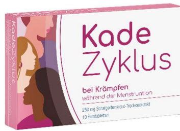
Abbildung 9: KadeZyklus bei Krämpfen Filmtabletten