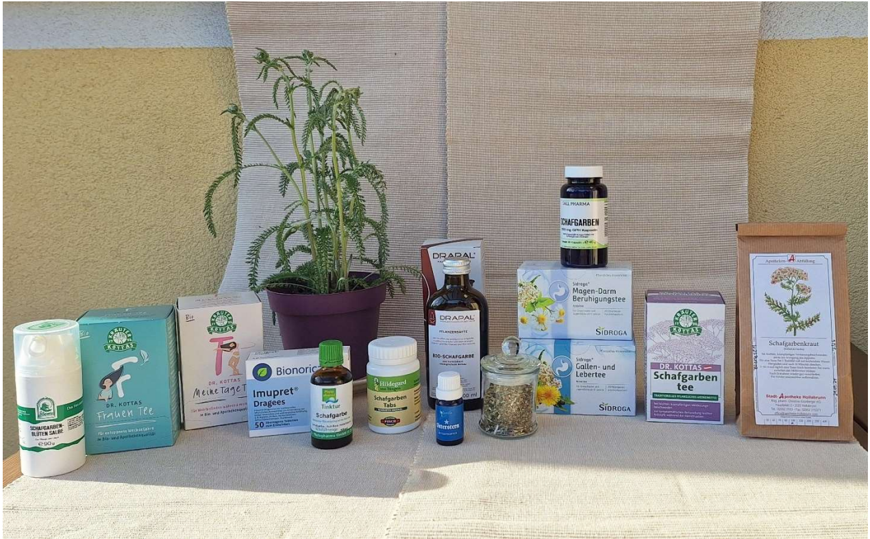
Abbildung 12 : Diverse Schafgarbenprodukte (Hainisch, 2025)