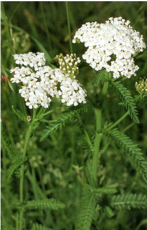
Abbildung 5: Achillea millefolium (Hensel, 1994, S. 125)

(google Bilder Achillea millefolium , 2025)