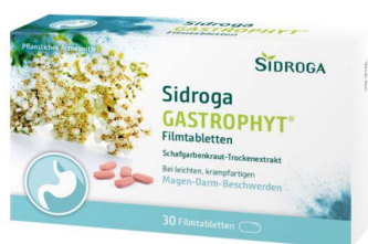
Abbildung 10: Sidroga Gastrophyt Filmtabletten